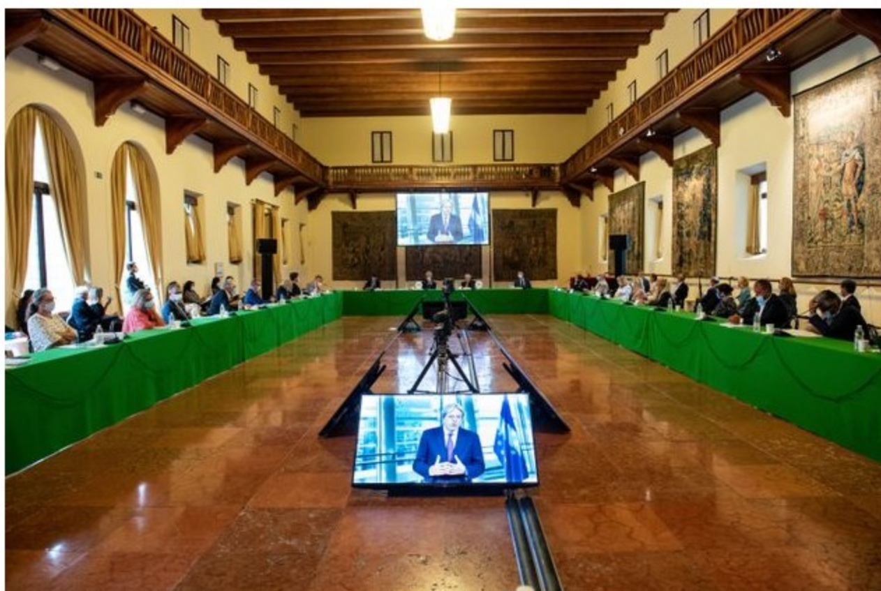
MIHAIL IOSIP Conferenza Soft Power

"Lanciare una conferenza sul Soft Power in questo momento storico può sembrare controcorrente, perché il mondo sta conoscendo un nuovo nazionalismo e crescenti difficoltà, ma è esattamente per questi motivi che una iniziativa di questo genere è così importante. Nessuno sa come sarà il mondo dopo la pandemia, ma sicuramente esploreremo la necessità di aumentare la cooperazione tra le nazioni sulla salute, sulla sicurezza, sulla ricerca". E' quanto afferma Paolo Gentiloni nel messaggio che il Commissario europeo all'Economia ha inviato alla prima Soft Power Conference, organizzata da Francesco Rutelli a Venezia dal 31 agosto all'1 settembre presso la fondazione Giorgio Cini e la fondazione Prada. La conferenza nasce dalla consapevolezza che dialogo e cooperazione internazionale, malgrado le attuali difficoltà, siano più che mai importanti. E dalla convinzione che un rinnovato Soft Power possa sostenere la reciproca comprensione tra le Nazioni, e tra i cittadini, giovare alla diversità e al pluralismo delle culture, alle attività d'impresa e al commercio mondiale, contribuendo a contrastare e ridurre le disuguaglianze.